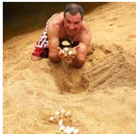
Кладка огромной черепахи