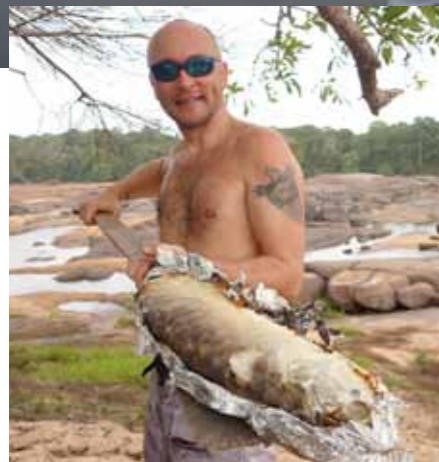
Аруана запеченная в фольге — это настоящий деликатес