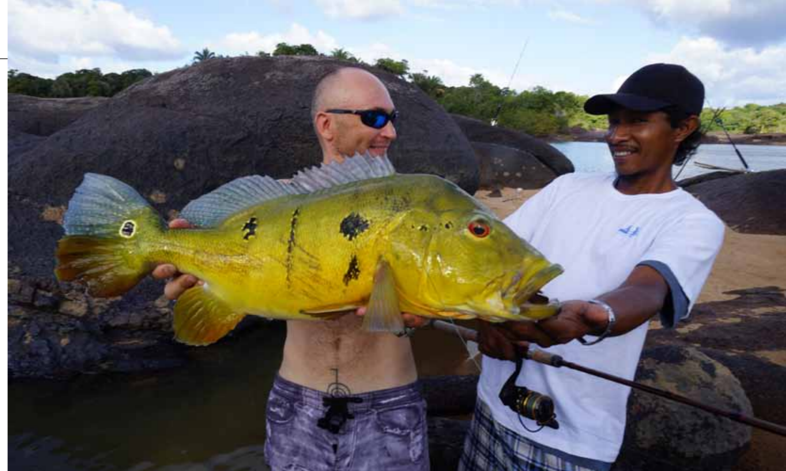
Павлиний окунь — красавец и боец

Пасть арапаймы относительно небольшая по сравнению с туловищем, но это не мешает ей заглатывать довольно крупные объекты. Я заметил, что эти рыбы отдают предпочтение объемным наживкам, и рекомендовал ребятам использовать крупные куски пираний, павлиньих окуней и бикуд, которые выступали в качестве «червячка». Кстати, язык у арапаймы, которым они перемалывают пищу, невероятно шершавый, и местные жители используют его в качестве наждачной бумаги.