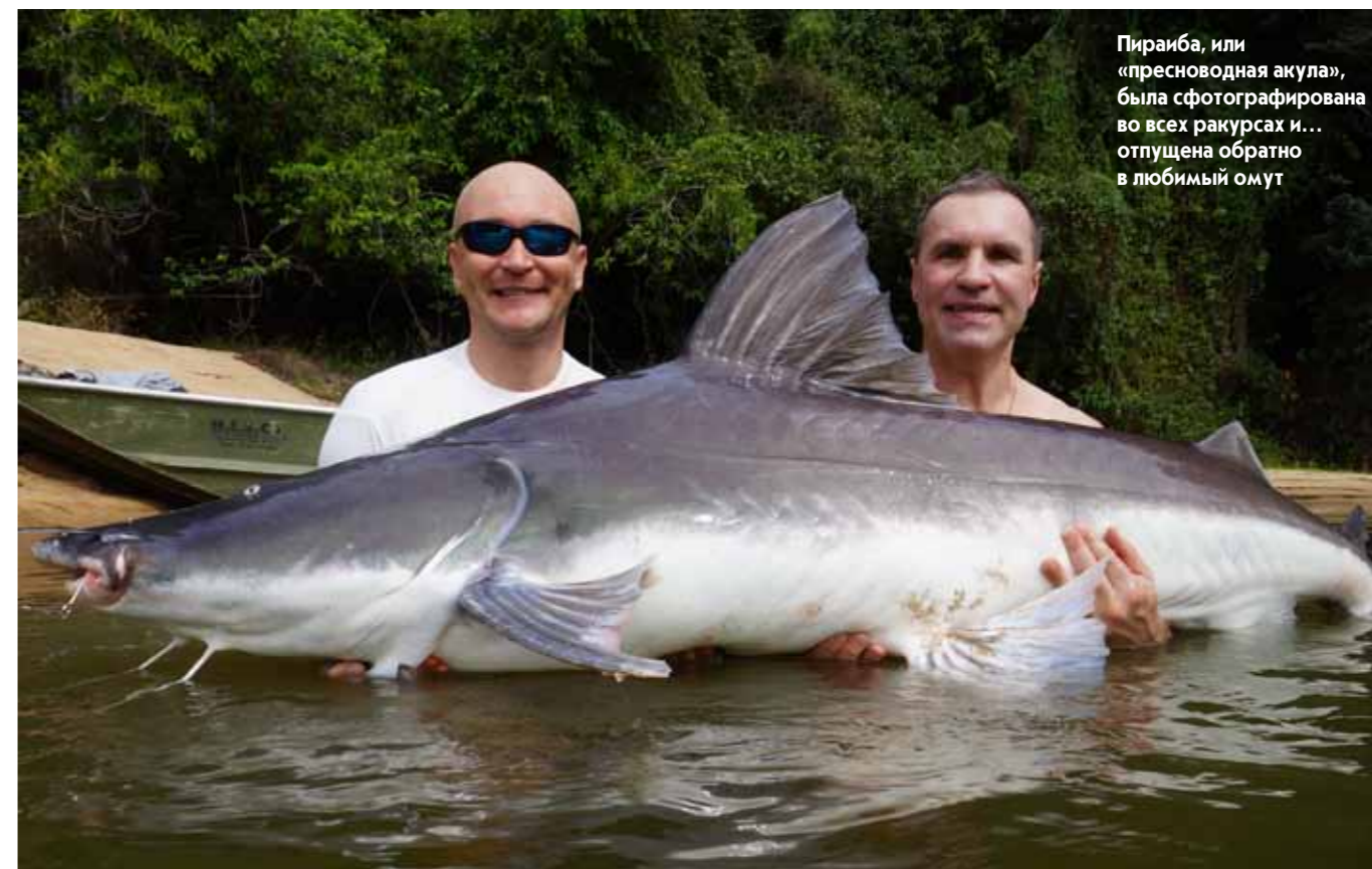
Пирайба, или «пресноводная акула», была сфотографирована во всех ракурсах и... отпущена обратно в любимый омут

И так получилось, что как раз здесь мы встретили ребят, возвращавшихся