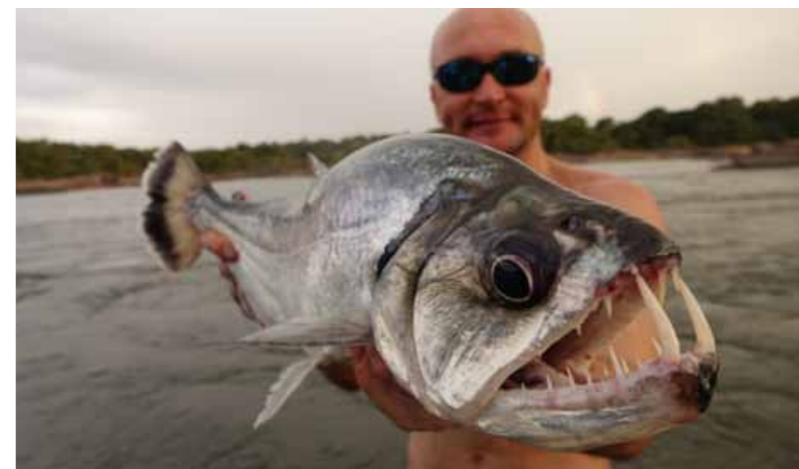
Автор статьи с пайарой

На следующий день наша команда выдвинулась за арапаймой в места,