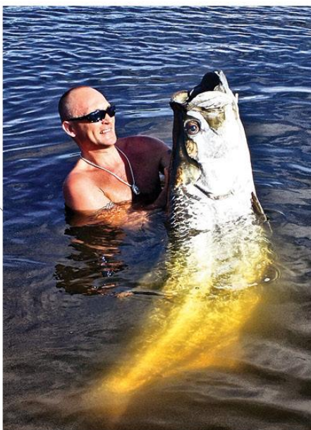
Карибское побережье Коста-Рики позволяет организовать отличную рыбалку на тарпона практически круглогодично