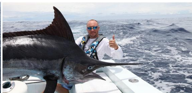
Мы организуем гарантированную рыбалку на марлина в лучшем в мире месте с лучшим шкипером