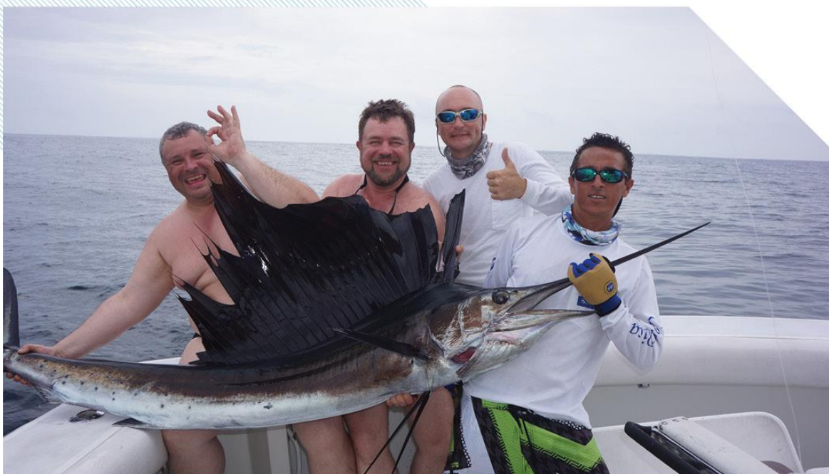
До 20 парусников в день – реальный результат в Коста-Рике, Мексике и Гватемале