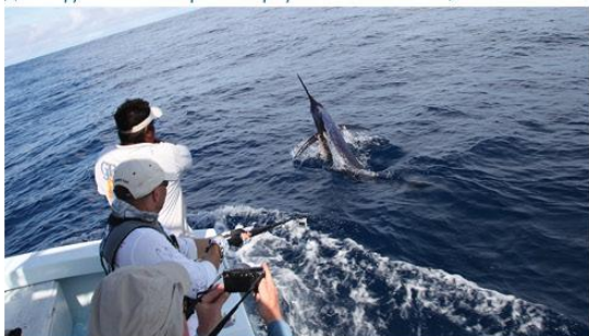
Неотъемлемой частью каждой нашей рыбалки является видео – и фотосъемка