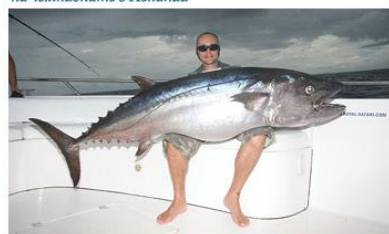
Одним из лучших мест для ловли крупных собакозубых тунцов является плато Судан (180 км от Маврикия)